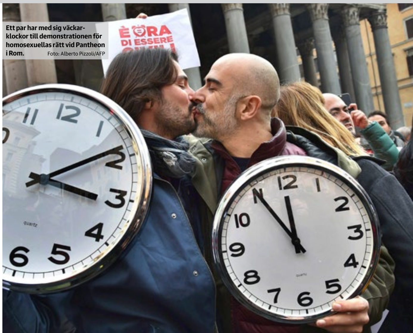
Ett par har med sig väckarklockor till demonstrationen för homosexuellas rätt vid Pantheon i Rom.

Turkiet. Åklagare yrkar på livstids fängelse för två journalister. Bakgrunden är ett avslöjande i tidningen Cumhuriyet med bilder som sades visa hur regeringen försökte smuggla vapen till islamister i Syrien. "Vapenleveranserna har varit olagliga, vilket inte heller regeringen kunnat förneka. I stället hävdar regeringen att nyhetsartikeln rör statshemligheter", skrev en av de åtalade, chefredaktören Can Dündar, i DN tidigare i januari. TT